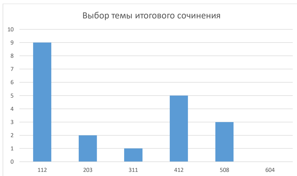
Диаграмма 2. Выбор тем итогового сочинения выпускниками 11-го класса

Из диаграммы видно, что 9 обучающихся выбрали тему № 112. Самая непопулярная тема № 604, ее не выбрал ни один человек.